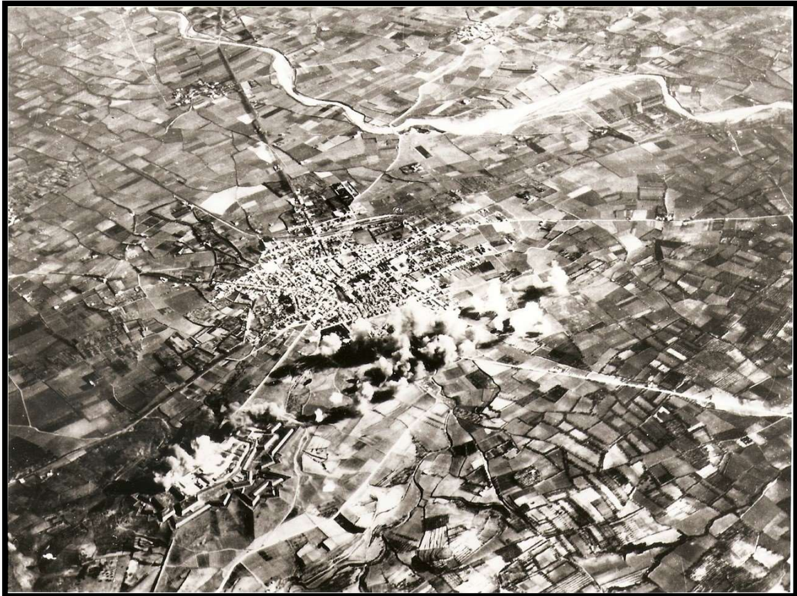
Imatge: Bombardeig a Figueres durant la GCE.