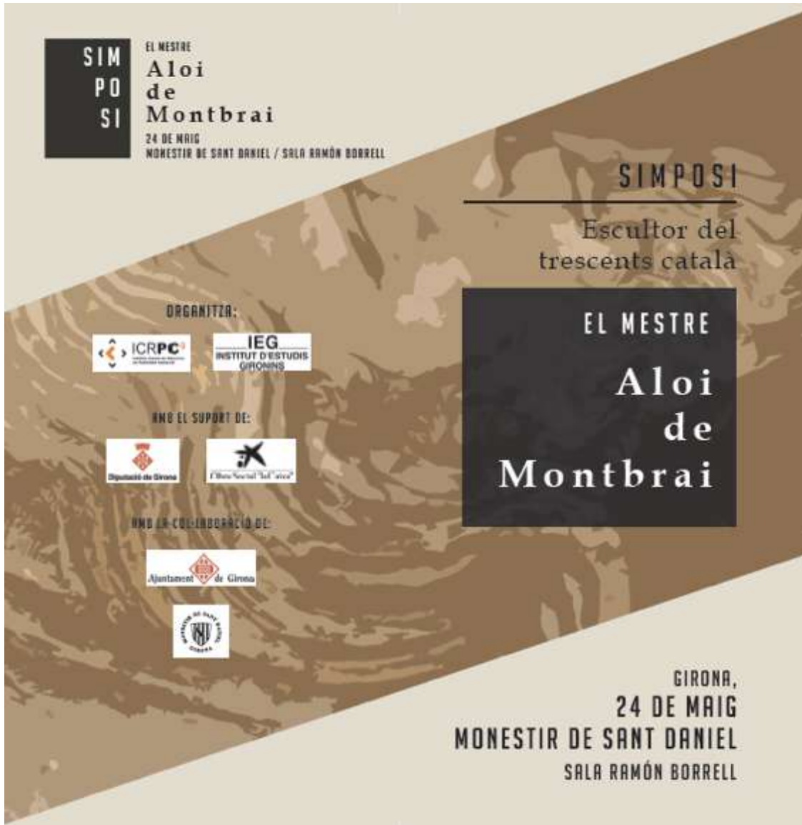
Cartell del seminari coordinat entre l'ICRPC i l'Institut d'Estudis Gironins, el 24 maig de 2019.