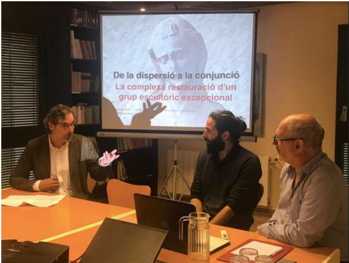
Debat en el Seminari "El Mestre Aloi de Montbrai".