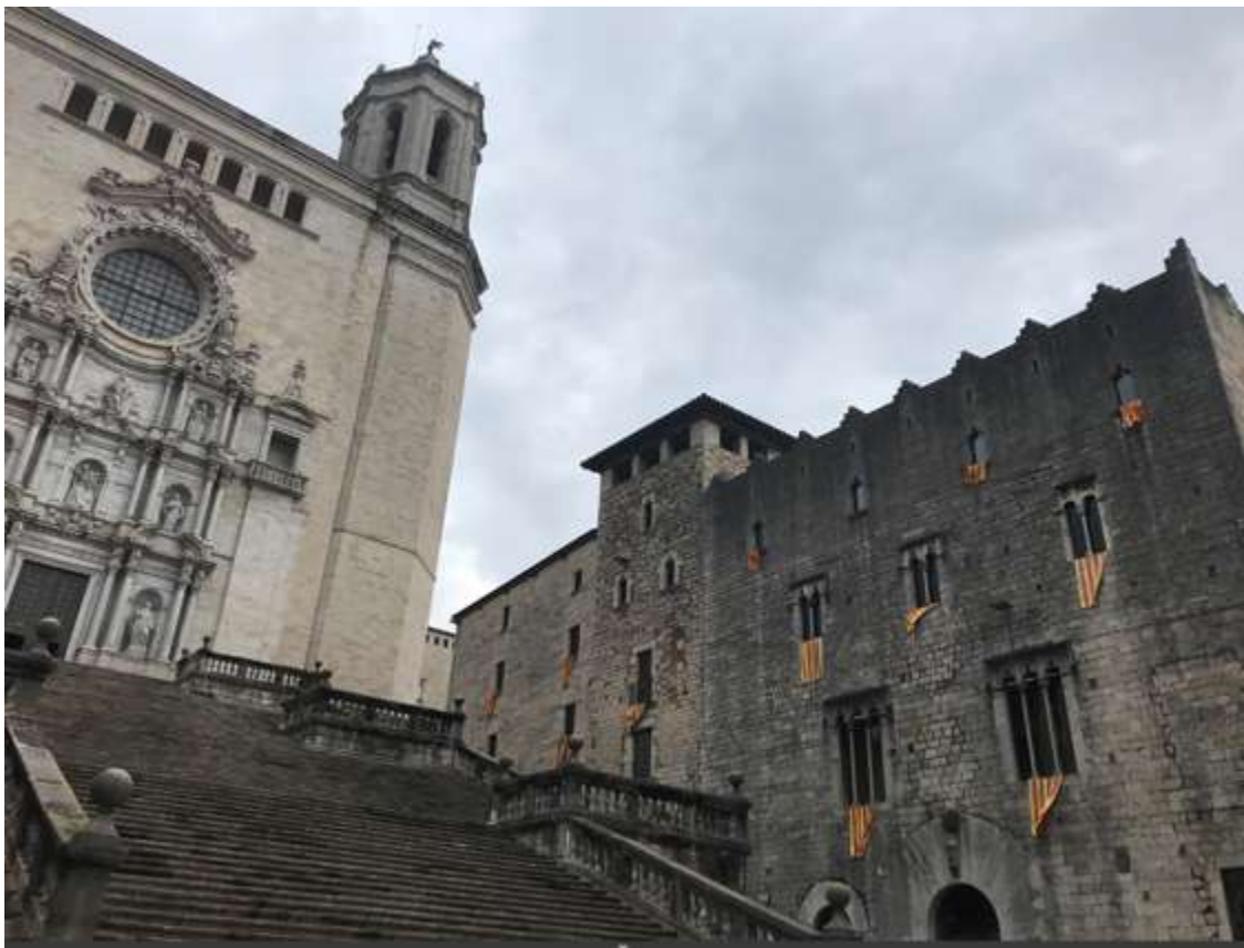
Edifici de la Pia Almoïna de Girona, seu de la Demarcació de Girona del Col·legi d'Arquitectes de Catalunya (COAC) i de l'Institut Català de Recerca en Patrimoni Cultural (ICRPC).

L'ICRPC té la seva seu a Girona, a l'Edifici Pia Almoïna, (plaça de la Catedral 8, 17004 Girona). Actualment aquest edifici és la seu de la demarcació de Girona del Col·legi d'Arquitectes de Catalunya (COAC). La seva ubicació fa possible estar a prop de les Facultats de Lletres i Turisme, així com de la d'Educació i Psicologia. L'ICRPC és centre adscrit a la Universitat de Girona. L'Institut actua com un centre català, amb seu a Girona i amb projecció internacional.