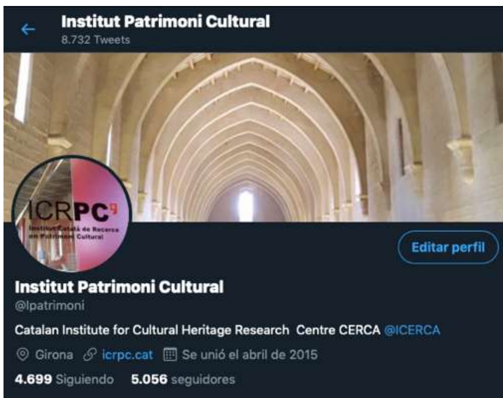
Amb l'ús de les xarxes socials l'ICRPC cerca una ampliació dels resultats de les seves activitats.